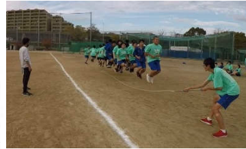
第1回スポーツ大会 優勝6組(上) 第2位 4組(右上) 第3位 5組(右下)