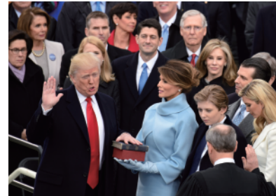
3 アメリカ大統領就任式 2017年。連邦最高裁判所長官のまえで就任宣誓をおこなうトランプ大統領。

発展途上国の政治制度……アジアの発展途上国では、経済開発を目的とする開発独裁や軍部による強権的な政治がおこなわれた。しかし1980年代以降、多くのアジア諸国では、軍部などの独裁体制が崩壊し、民主的な大統領制(韓国、フィリピン)や議院内閣制(タイ)となった。