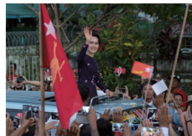
7 アウンサンスーチー ミャンマーの民主化運動の指導者。2015年の選挙で同氏が率いる国民民主連盟が圧勝したことで、半世紀にわたって続いた軍事政権が崩壊した。