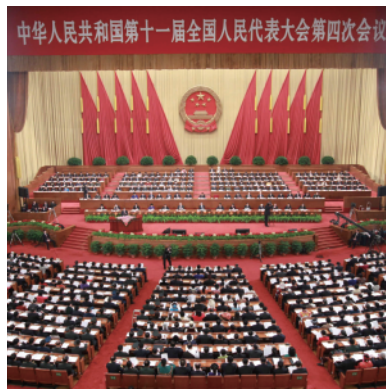
6 全国人民代表大会 2011年。憲法の改正や法律の制定、国家主席などの選出、予算や経済計画の審議などがおこなわれる。解散はなく、年に1回開催される。