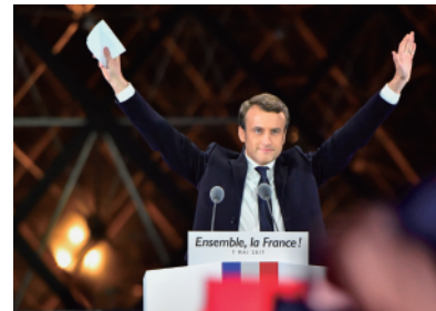
4 フランスの大統領選挙 2017年。フランス大統領は任期5年で、国民の直接選挙で選ばれる。