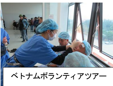
ベトナムボランティアツアー