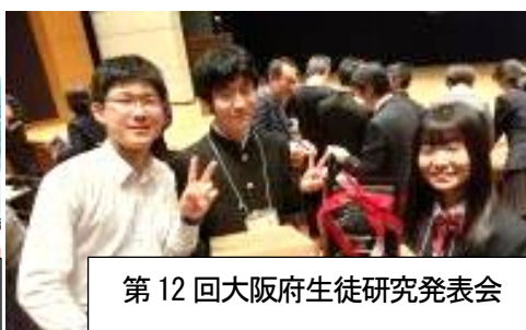
第12回大阪府生徒研究発表会