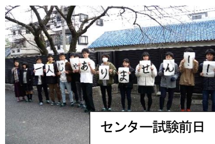
センター試験前日