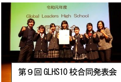
第9回GLHS10校合同発表会