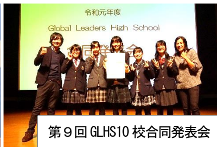
第9回 GLHS10 校合同発表会