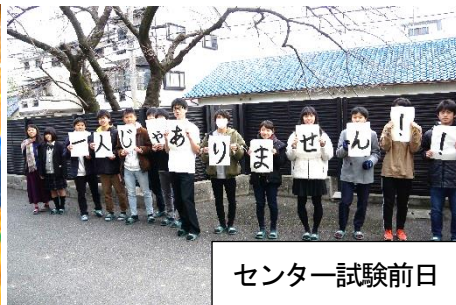
センター試験前日