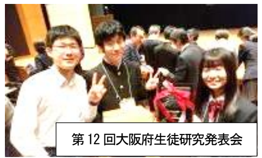
第12回大阪府生徒研究発表会