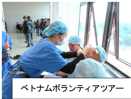
ベトナムボランティアツアー