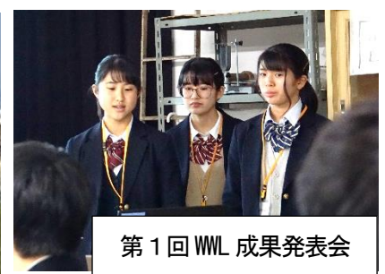
第1回 WWL 成果発表会