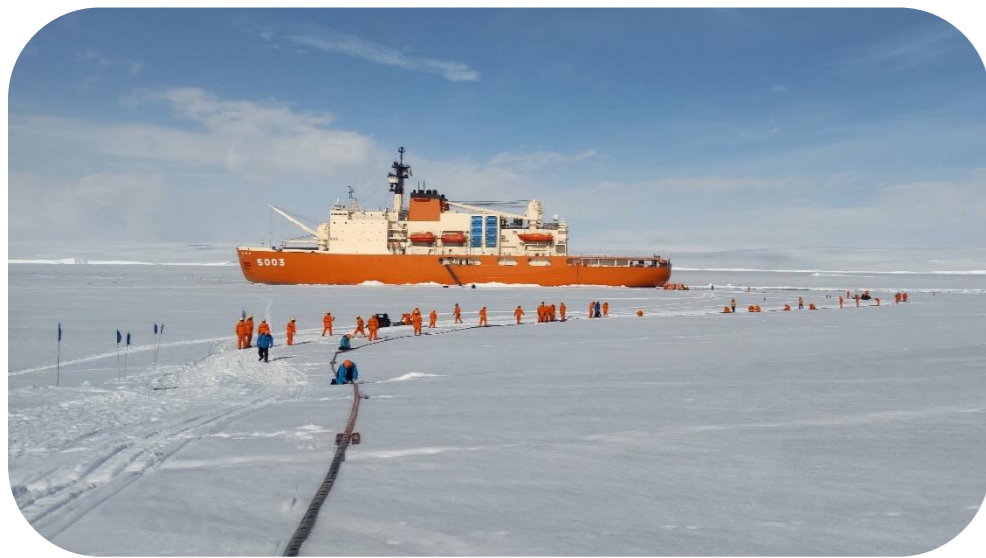
ねんりょう しょうわきち おく ☆燃料をしらせから昭和基地に送っています☆