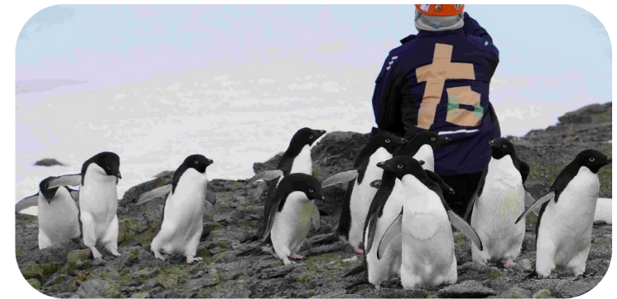
しょうわきち なか あでりーペンギン ☆昭和基地の中にもアデリーペンギン☆