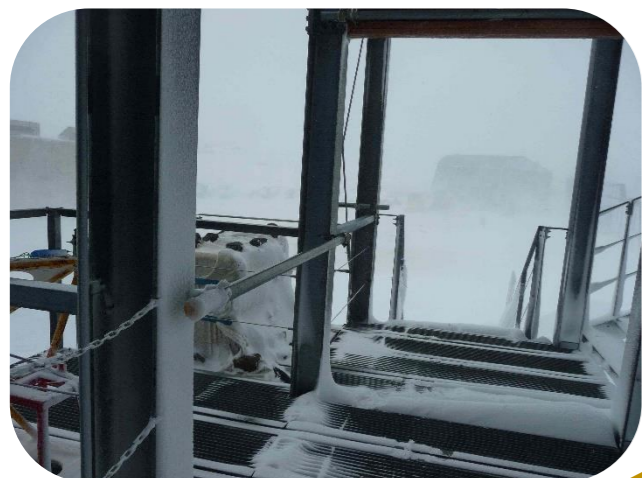
ぶり き ☆ブリが来た！☆