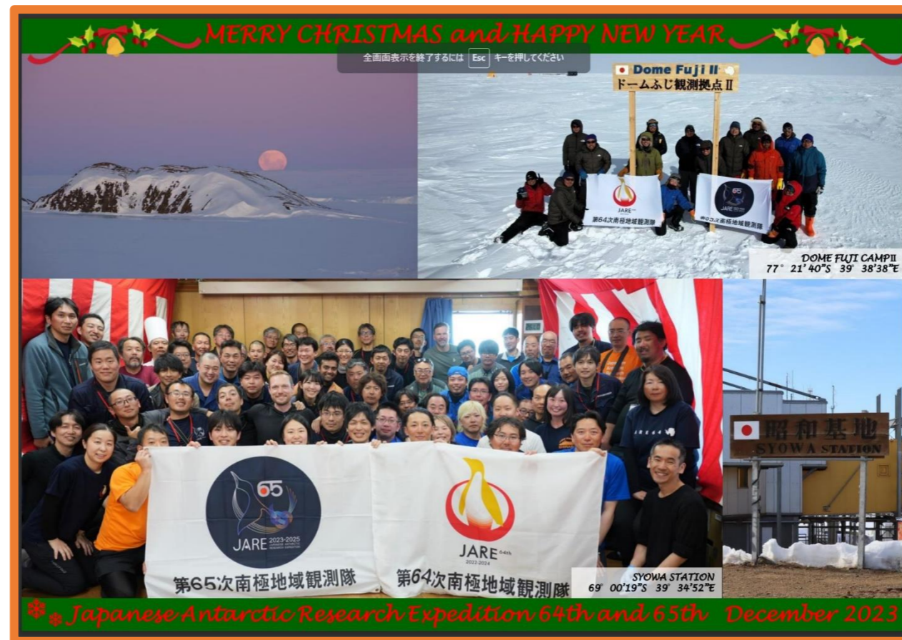
しょうわきち とうむふじ ☆昭和基地とドームふじにいる観測隊員☆