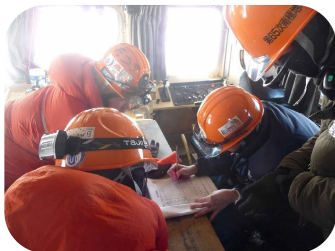
せつじょうしゃ うご じゅんびちゆう ☆雪上車を動かす準備中☆