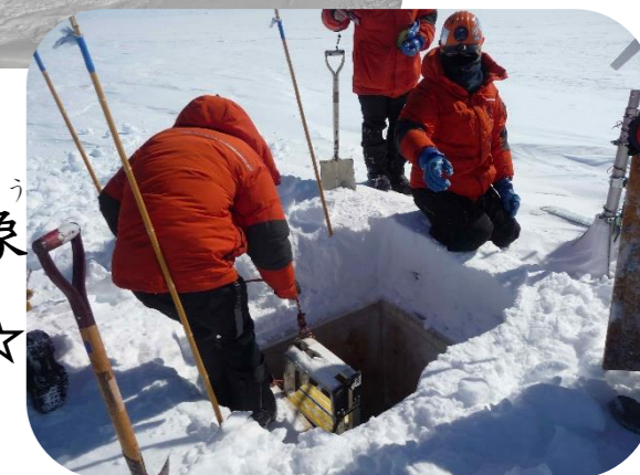
えす ☆ここはS17。 やね きしょう 屋根までうまった気象 こや いらぐち 小屋の入口をほります☆