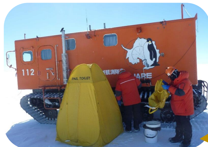
なんきょく のこ あしあと ☆南極に残しているのは足跡だけ☆