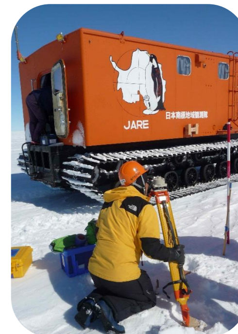
たいりくひょうめん こおり ねん めーとるうご ☆大陸表面の氷は1年に7m動いている！☆