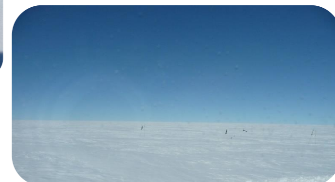
こおり かっそうろ はた めじるし ☆氷の滑走路。旗だけが目印です。☆