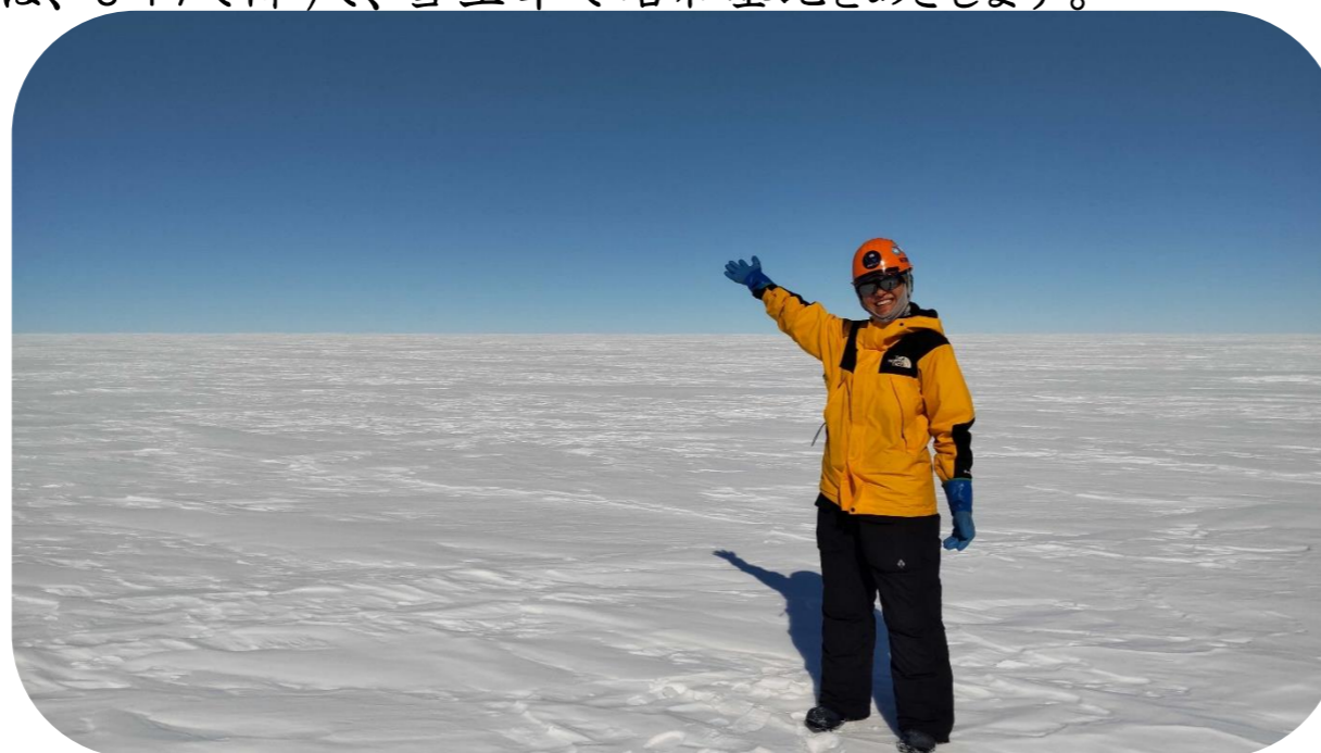
なんきょくたいりく じょうりく まっしろ こおり せかい ☆南極大陸に上陸！真っ白な氷の世界です☆