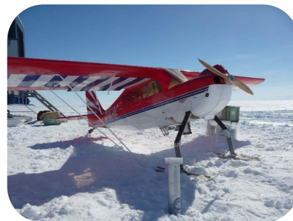
ぺねとれーたー ☆ペネトレーターの じっけん じゅんびちゆう 実験の準備中☆

ひこうき しょうわきち くひと えす お せつじょうしゃ しょうわきち 飛行機で昭和基地に来る人は、S17で降りて、雪上車で昭和基地をめざします。