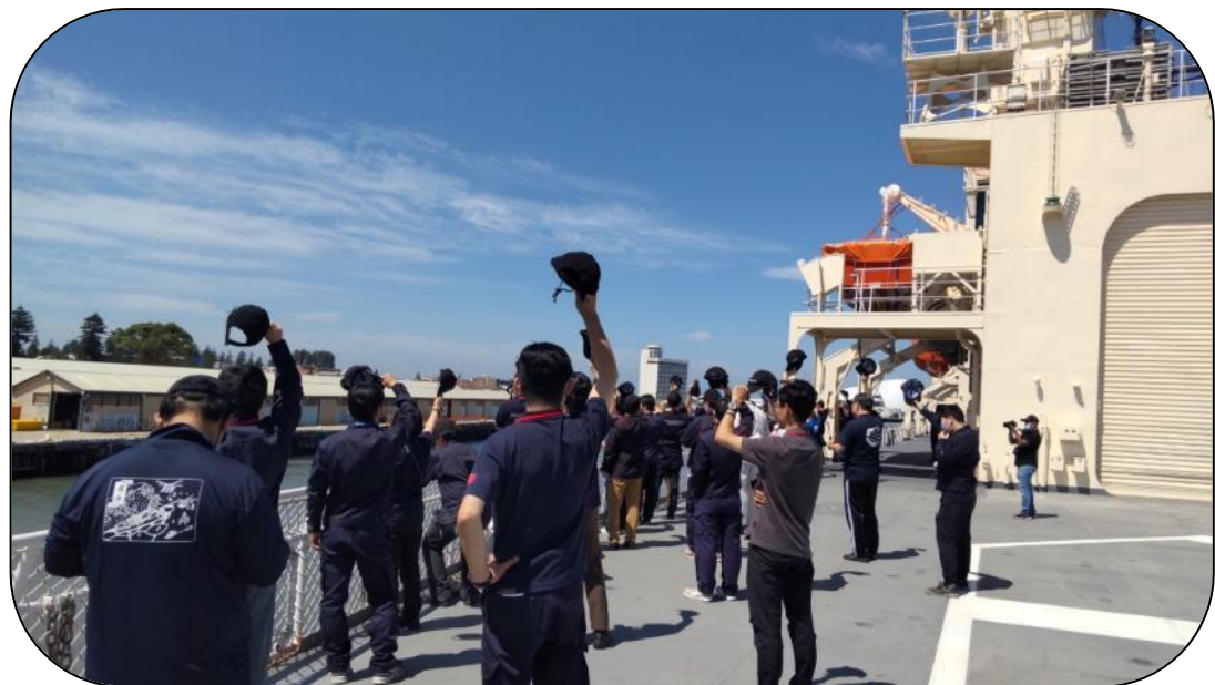
て かんそくたいいん ☆しらせから手をふる観測隊員☆

あさ 11月30日の朝10時、しらせはオーストラリアのフリーマントル港を出発しました。 こくりつきょくちけんきゅうしょ かた おーすとらりあ す にほんじん かた かんそくたいいん かぞく 国立極地研究所の方やオーストラリアに住む日本人の方、観測隊員の家族など かた みおく き たくさんの方が見送りに来てくれました。-