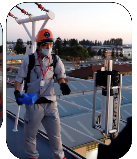
なみ 撮影: JARE65 丹保俊哉 ☆波のしぶきをはかる機器☆