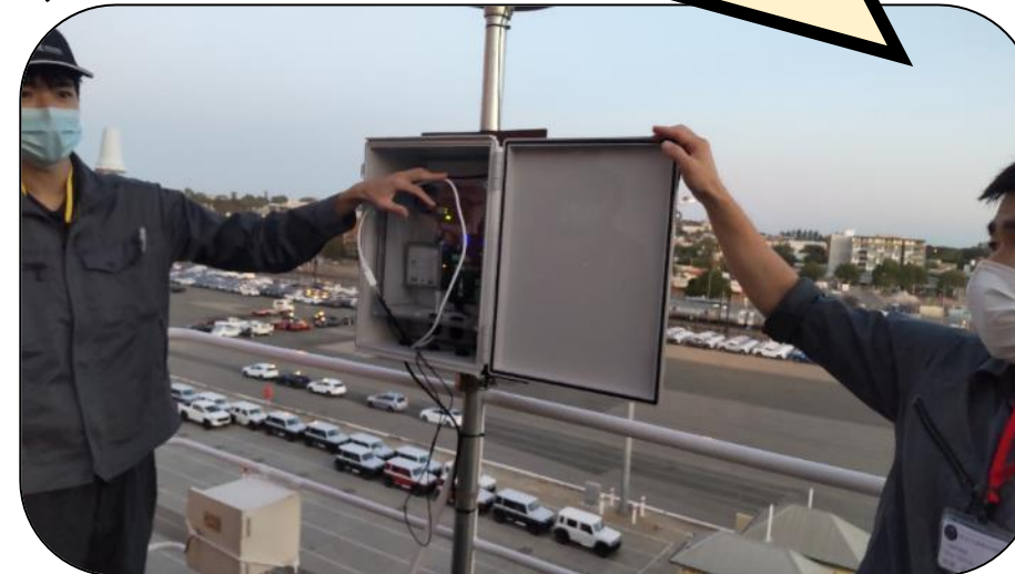
ふね うご しら きき ☆船の動きを調べる機器☆