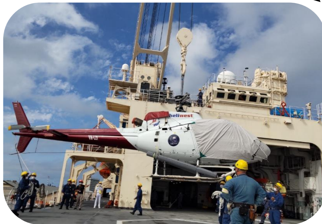
へりこぶたー どうさい ☆ヘリコプターの搭載☆