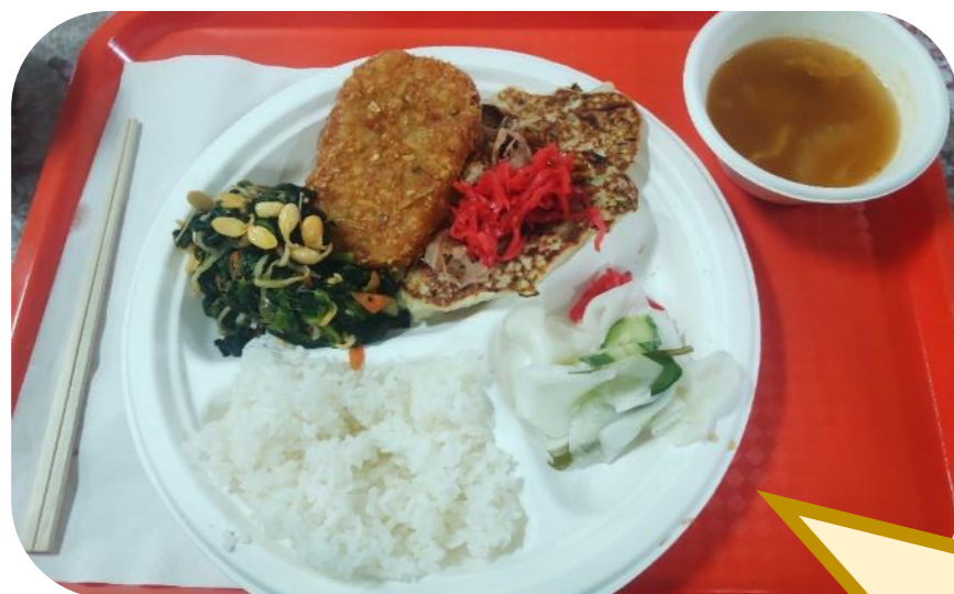
よる はん ☆26日の夜ご飯☆