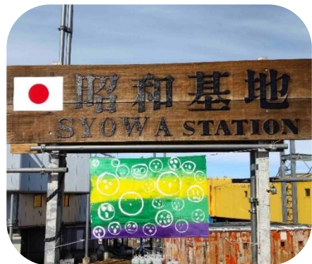
いちきゅうひろば すいたばんなんきよく はた ☆19広場に吹田版南極の旗！☆