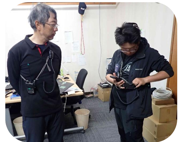
でいれくたー おせん かくにん ☆ディレクターは無線の確認☆