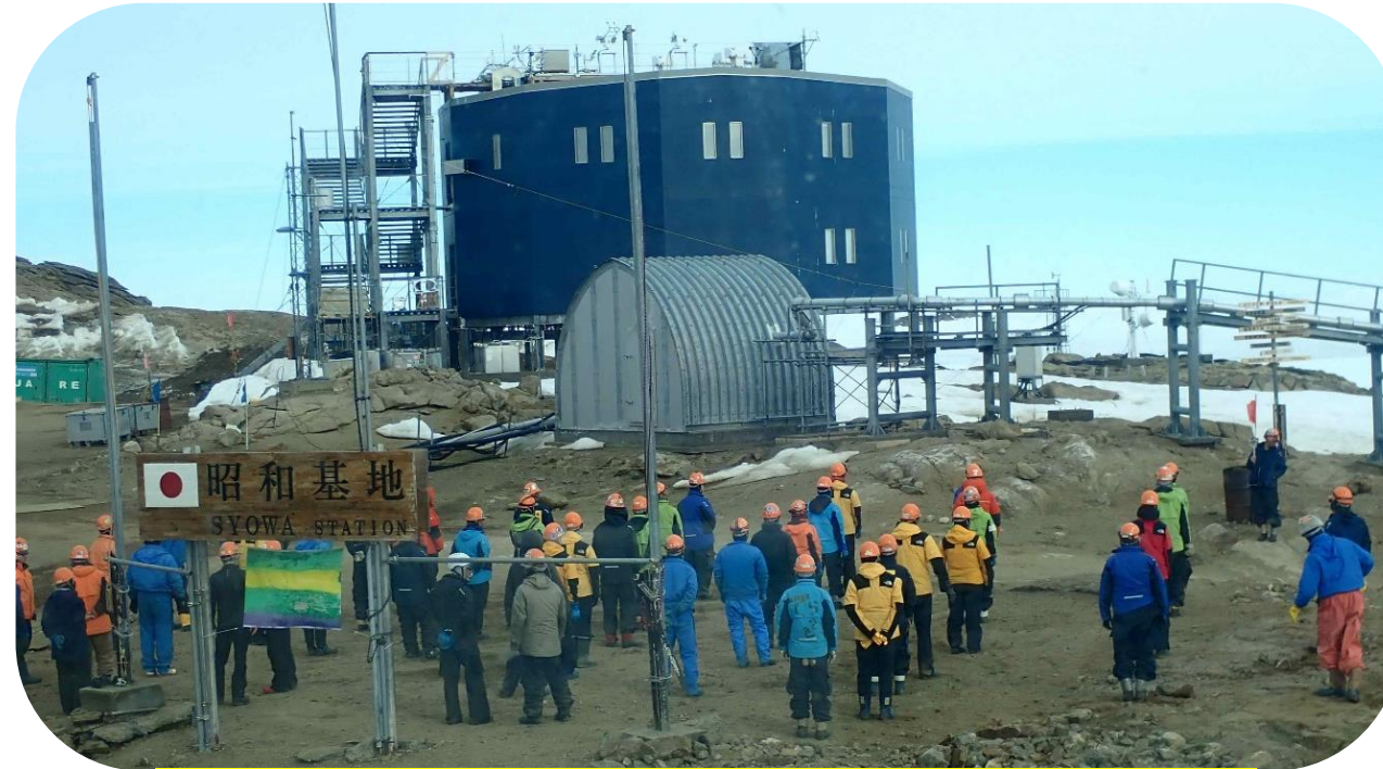
らじおたいそう あつ かんそくたいいん ☆“みんなでラジオ体操”に集まった観測隊員☆