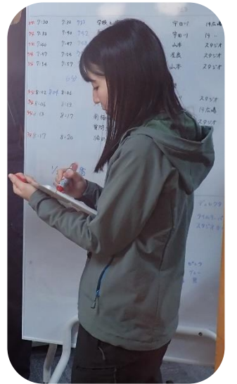
たいむキーパー ☆タイムキーパー☆