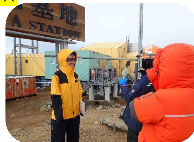
ちゅうけい りはーさるちゅう ☆中継のリハーサル中☆