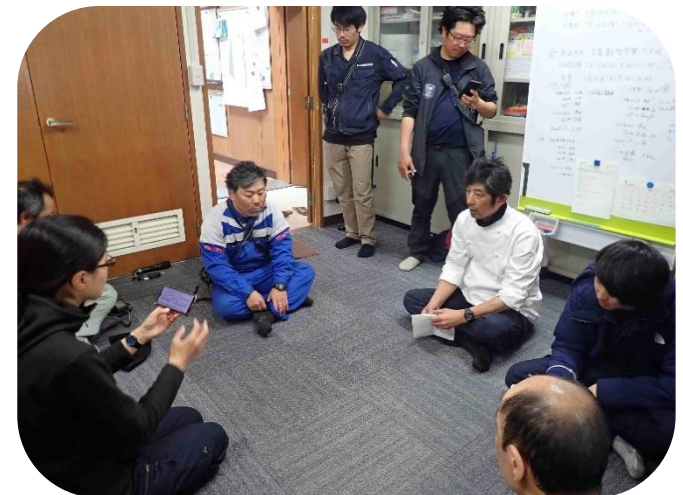
さいしゅうかくにんちゅう ☆みんなで最終確認中☆

「たくさんいろいろなことを経験して、楽しいと思うことや好きなことを見つけてください。」