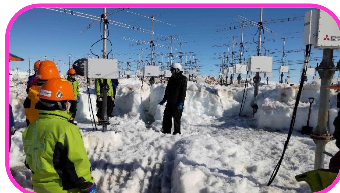
ほん ばんじーれーだー ☆1045本あるPANSYLレーダー ゆき 雪かきがたいへん！！☆