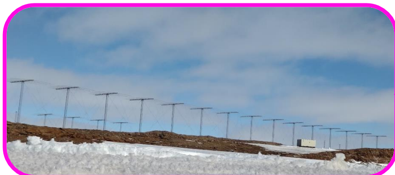
おお えいちえふれーだー ☆とても大きなH Fレーダー☆

国立極地研究所のホームページに “『作品展～南極の旗～』開催！”が 掲載されました。 https://nipr-blog.nipr.ac.jp/jare/20240114post-447.html