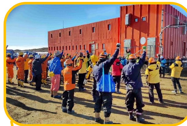
あさ ☆朝はみんなで しごと かくにん らじおたいそう 仕事の確認とラジオ体操☆