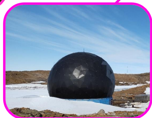
なか おお あんてな ☆中に大きなアンテナがあります☆