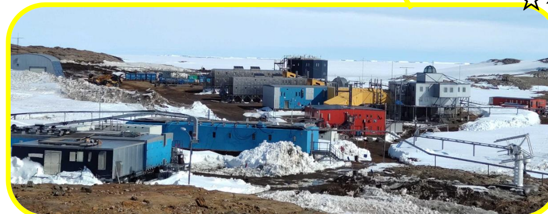
しょうわきち ちゅうしんぶぶん ☆昭和基地の中心部分☆