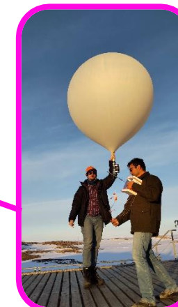
かんそくきき と ☆観測機器を飛ばします☆