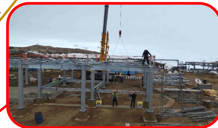
しんなつしゅく けんちくちゅう こんかい かいぶぶん ☆『新夏宿』建築中(今回は1階部分まで)☆