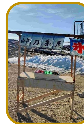
とうげ ちゃや ☆『嶺の茶屋』 す の もの 好きな飲み物を もらえるよ☆