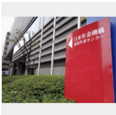
日本年金機構の障害年金センター = 11日、東京都新宿区

障害者に支給される国の障害年金を申請して2024年度に不支給と判定された人が、23年度の2倍以上に急増し約3万人に上ることが28日、共同通信が入手した日本年金機構の内部資料で分かった。機構が統計を取り始めた19年度以降で最多。審査された6人に1人程度が不支給になった計算で、割合も前年度の約2倍に増え、過去最大となる見通し。