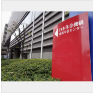
日本年金機構の障害年金センター＝4月、東京都新宿区

国の障害年金を不支給とされた人が2024年度に増えた問題を巡り、日本年金機構が検証のため、不支給と判定したうち千数百件について内部でひそかに判定をやり直していたことが25日、関係者への取材で分かった。通常、再判定することはなく、異例の措置。