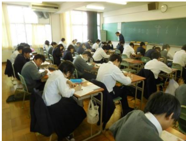
<プレ土曜講習を受講する1年生の生徒たち>

講習は授業ではありませんから希望制です。実態としては多くの生徒が受講していますが、平日に行われる授業での学習も結構な量になりますから、自分のスケジュールを考えて、チャレンジする人は受講してもらえれば結構です。