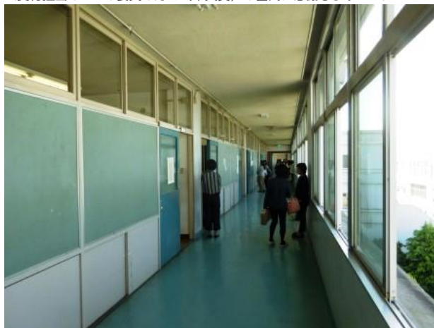
<授業中、廊下を行き来される保護者の方々のマナーも素晴らしかったです！！>