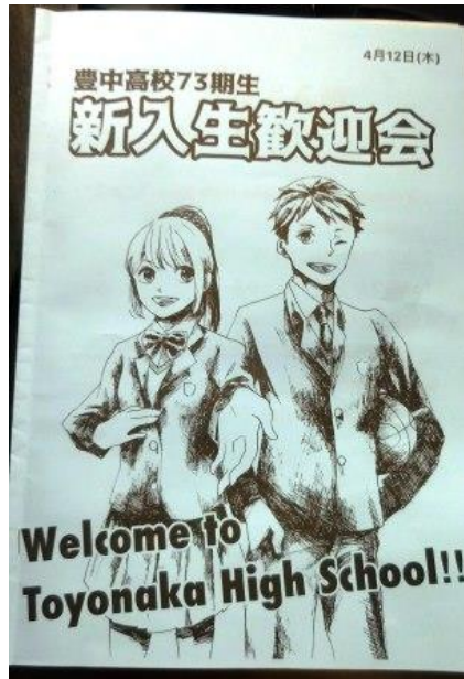
＜しおりは、マンガイラスト研究部による作品＞

4月12日(木) 15:00~柔剣道場で、新入生の歓迎会が行われました。 最初、自治会の副会長のあいさつがあり、その後、各クラブの1分間紹介が続きました。 歓迎会后、グラウンドや部室などで新入生の部活動見学の姿が見られました。 部活動には、授業などの勉強だけでは学べないたくさんの方がいると思います、 新入生ひとりひとりが自分に合った部活動に出会うことを期待しています。