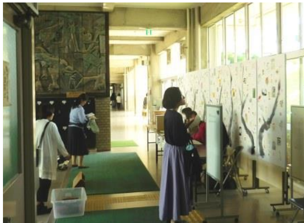
<受付担当のPTAの委員の方々（中央奥）の奮闘に感謝します！！>

4月20日（金）の午後、5・6限目の授業を保護者の方々に公開いたしました。300名を超える保護者の方々にご覧頂きました。本校の授業の雰囲気を感じていただけたのではないのでしょうか。授業公開終了後、放課後の時間を活用して、保護者の方々とホームルーム担任との学級懇談会を実施しました。豊中高校では、このように、「豊高生第1」をキーワードに保護者の皆様と「協力」「公開」「連携」を深めていきたいと思っています。