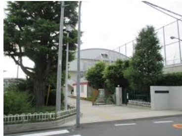
<ありし日のヒマラヤ杉（左）と植樹後約20年のヒマラヤ杉（右）>

後日、株も撤去する日を迎えるが、遺品ともいえる木目美しき幹の一部分は大切に保管し、3年後の創立100周年の折には、豊高生・豊中生の思い出の品として再会を期したい。