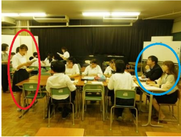
<意見を英語で述べる豊高生（赤丸）とそれを聞く生徒と外部講師（青丸）>