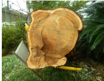
<創立100周年に向けての再会を待つ幹>