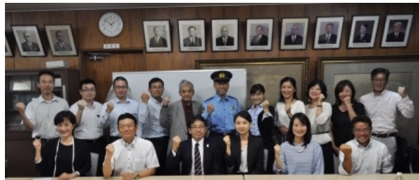
<さまざまな職業の豊高卒業生>