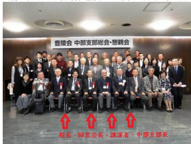
<参加者全員で記念撮影>

何事にもチャレンジされる氏の生き方にたくさんのエネルギーをいただいた気がしました。