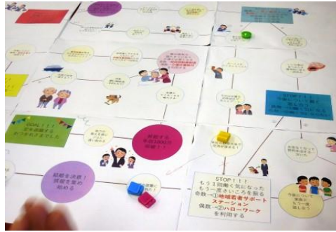
<人生をすごろくで仮想体験>

生徒たちは、身近に感じにくい労働問題について、楽しみながら学ぶ機会としたようでした。