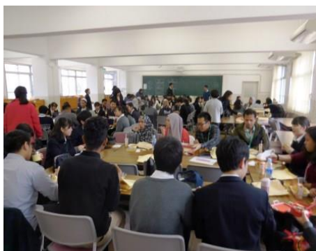
<グループに分かれて話の花が咲きます>

40人を超える豊高生とアジアの留学生とが一堂に会し、昼食をともにしながら英語での交流をしました。