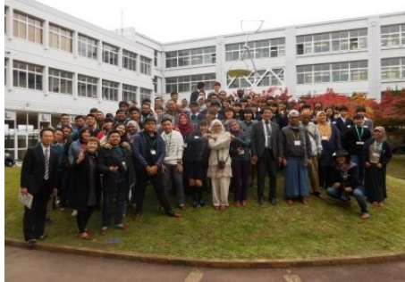
<中庭での記念撮影>