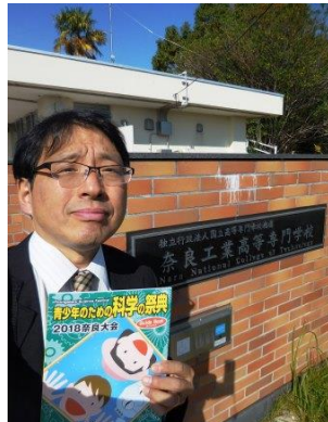
<パンフレットをもち記念撮影>

豊中高校では「課題研究」の授業などを通して、小学生達の自然に対する純粋な驚きや感動を大切にしながら、高校時代に深く探究できるような授業の提供を行っています。