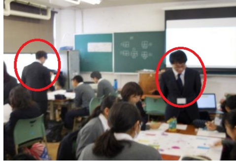
<市大生5人が学びをアシスト>