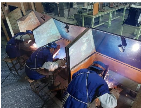
2, 3 年溶接練習の図