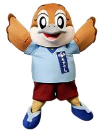
大阪府広報担当副知事 もずやん