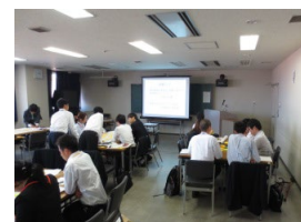
「プレゼンテーション力向上」【演習】

大阪府教育センター等の研修は、4月から3月までの年間12回程度行われます。（49ページの「新規採用小・中学校事務職員研修年間計画」を参照）