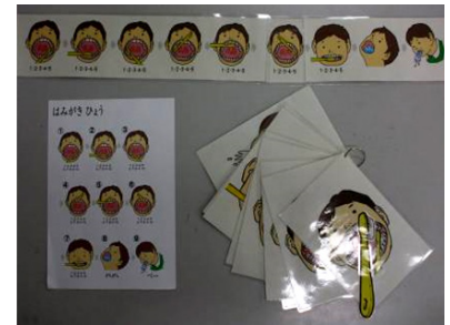
複数の支援ツール