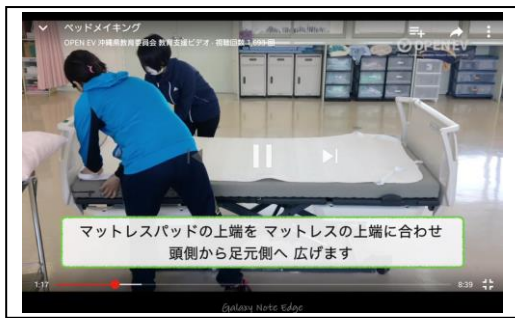
【You Tube で動画視聴】