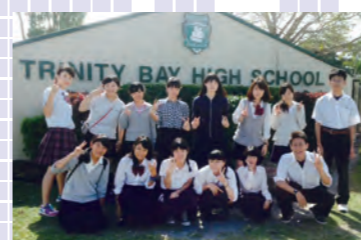
オーストラリア語学研修