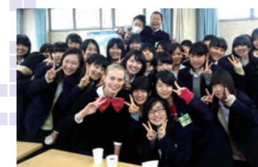
留学生の受け入れ