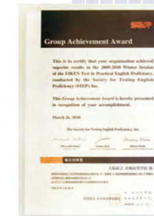
英語検定の校内実施 年2回(6月、1月)