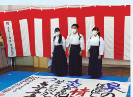
創立 80 周年記念式典 (本校生によるパフォーマンス)