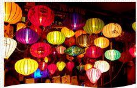
毎月旧暦の14日はホイアンのランタン祭り。