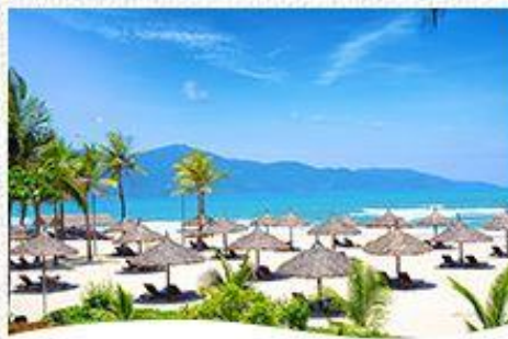
開放感あふれるビーチは大きな魅力。

さすがベトナム第3の都市だけあって、活気のあるダナン。夕暮れから夜にかけての景色の移り変わりを楽しんで。