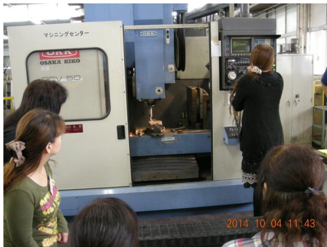
手仕上げにて面取り作業