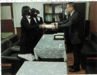
～～ 表彰状授与の様相 ～～