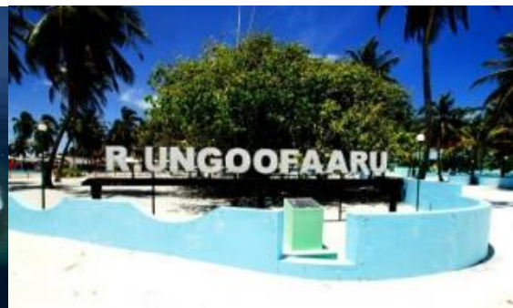
ラーアートル・ウングーフール島