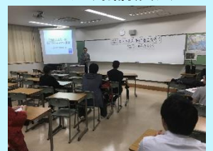
スーツ着こなし講座