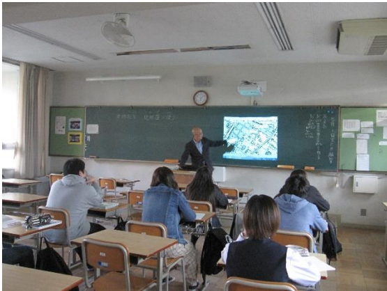
普段の授業の様子

「生徒一人ひとりの個性を伸ばし、豊かな人間性を育む」という目標のもと、HRや生徒会活動を通じて人のつながりを大切にして「成長を実感できるアットホームな居場所」をめざしています。