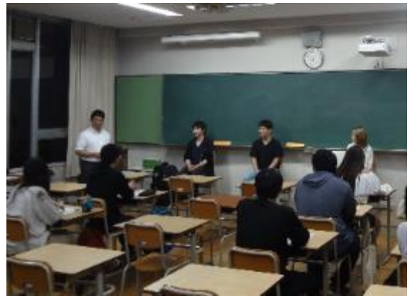
卒業生の進路体験を聞く会