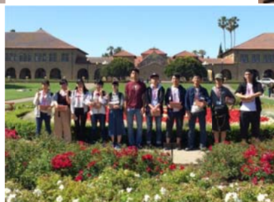
スタンフォード大学見学

9:00～12:00 スタンフォード大学見学 13:30～16:30 Google 訪問 19:00～21:00 ゲストスピーカー