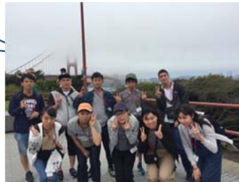
ゴールデンゲートブリッジ

14時に関西国際空港集合し、予定通り出発。同日の午前11時にサンフランシスコ空港に到着後、フィッシャーマンズ・ワーフ、ゴールデンゲートブリッジなどの観光地を巡り、研修実施大学であるカリフォルニア大学バークレー校の寮にチェックインし、オリエンテーションを受けた。