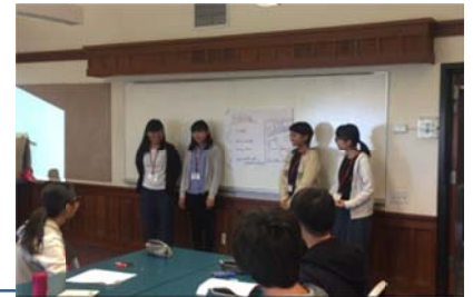
モーニングセッションの様子

9:00～12:00 モーニング・セッション 13:30～16:30 キャンパスツアー 19:00～21:00 イブニング・セッション