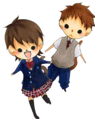
もみじちゃん あずまくん 【箕面東高校公式キャラクター】