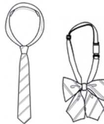
ネクタイまたはリボン