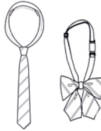
ネクタイまたはリボン