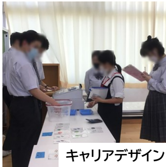
キャリアデザイン

むらのに通う1年生から3年生全員が3年間取り組む、働く姿勢を学ぶための教科です。