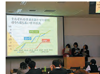
大阪府生徒研究発表会