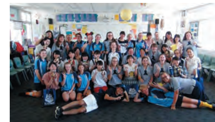
オーストラリア研修