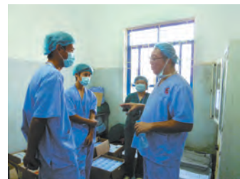
ベトナムの病院での医療ボランティア研修