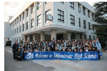
松山高級中学来校