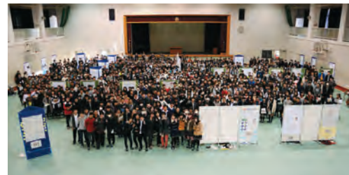
2年生探究チャレンジII