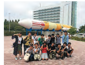
関東サイエンス研修