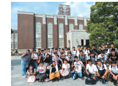
研究室訪問(京都大学)

生徒の学習意欲を喚起し、将来に対する意識を高めるために第一線で活躍している研究者や専門家の方を学校に招いて講演会などを実施しています。