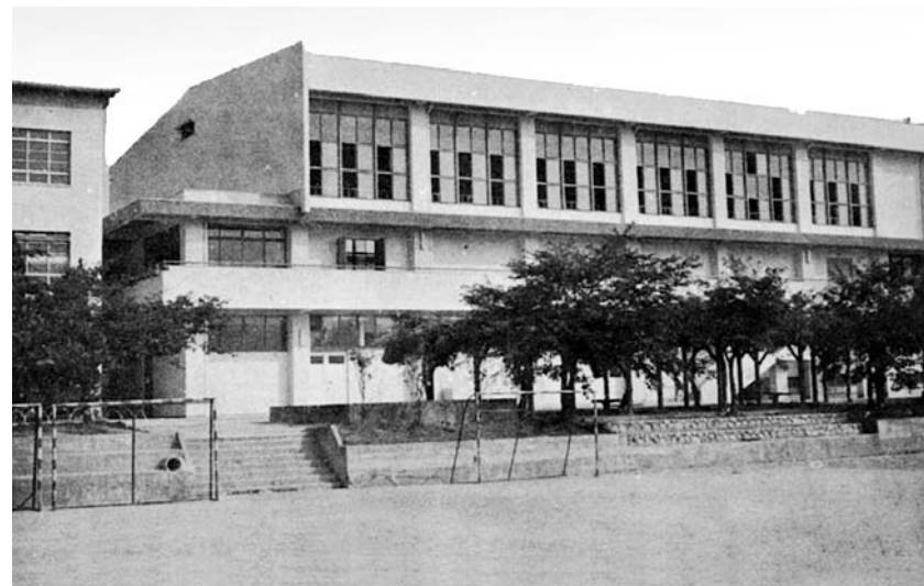
鉄筋化した体育館。昭和45年に完成した。