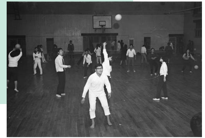
体育の授業。場所は鉄筋化する前の体育館。今より幾分狭く感じられる。