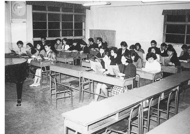
音楽の授業。昭和56年まで芸術の授業として音楽があった。