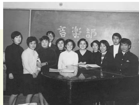
左から文芸部、英語部、音楽部。昭和43年に撮影。