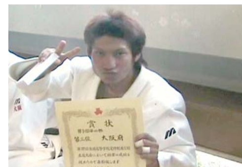
平成18年(2006)柔道部は、団体戦の大阪府代表として戦い、全国3位となる。