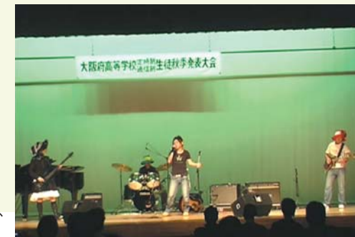
ギター部は、「We are Sneaker Ages」など、数多くの大会に参加。