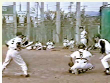
平成6~7年の2年間だけであったが、野球部も活動。