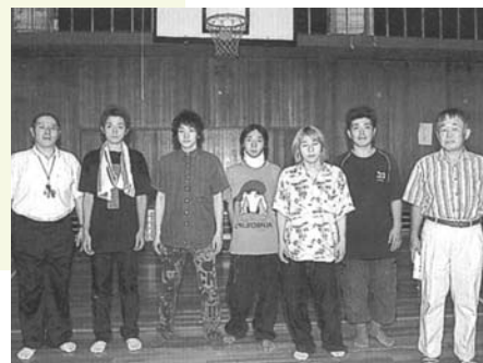
バスケットボール部は最も長い間活動していた。(昭和29年~平成17年)