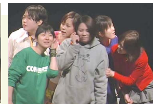
演劇部は、平成17年度に高校生北摂演劇フェスティバルに参加。