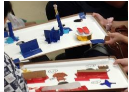
コロコロバイキング