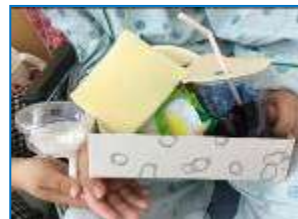
具沢山のサンドイッチ (^_^)