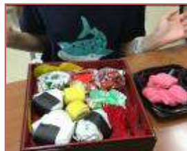
ウイナーがおいしそう (^_^)