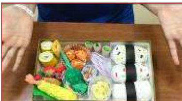
おにぎりにふりかけがかかっている (^_^)

9月の掲示板は、「秋の遠足」をストーリー仕立てで作成しました。秋の動物や虫たちが、森で楽しく遠足をしている様子が描かれています。院内学級の子どもたちは、折り紙や画用紙、粘土などあらゆる材料を使って楽しく動物のお弁当を作っていました。どれも本物のお弁当のように見えてきますね。