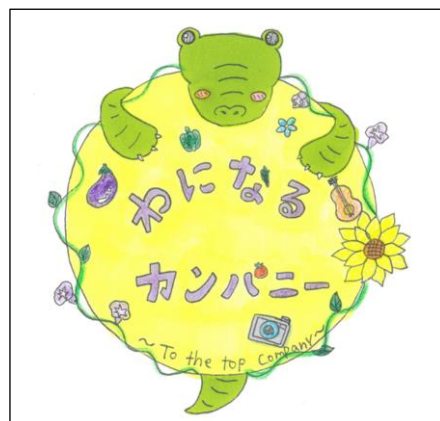
図2「わになるカンパニー」のロゴ

分教室の行事で保護者等に配付するプログラムのイラストや、わにカンや子会社のロゴの作成(図2)を、絵を描くことが得意な児童生徒が活動を行った。また、ICT 機器を使ったポスターや動画を作成する活動にも取り組んだ。