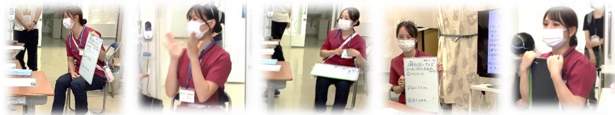
(写真) 看護学生さん

笑顔あふれる看護学生さんから、医療・衛生・健康に関するクイズや、看護師をめざす動機、努力していること等をインタビュー形式で伺った。医療の知識や技術も含め、患者さんの大切な命を預かる仕事であることを学んだ。