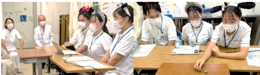
(写真) リハビリテーション学部作業療法学科の皆さん

やりたいけれど難しいことを支援し、できた喜びや自信につなげることが作業療法士の役割であると学んだ。指先の感覚を使ってお宝を探すゲームや、マジックショーを楽しみつつ、交流を通じて、患者に寄り添いながら、目標に向かって様々な工夫や支援をしていることを理解できた。