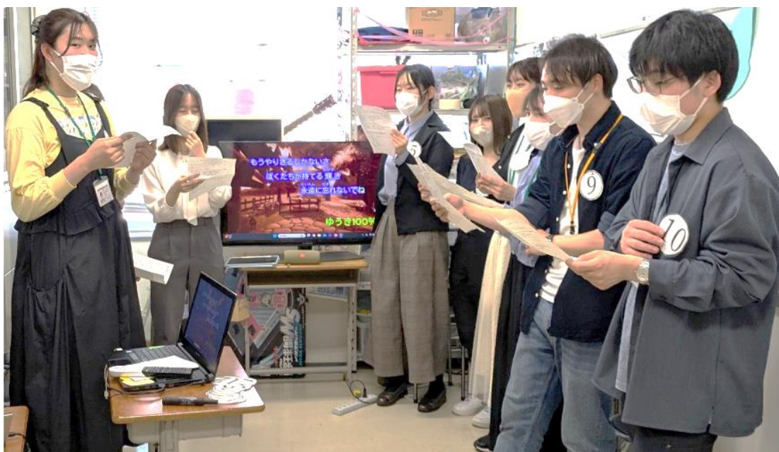
(写真) コールクライス（混声合唱）部の皆さん

大学の部活動である混声合唱部さん10人と、歌のイントロクイズや「勇気100%」の合唱で盛り上がった。仲間と気持ちを一つにして歌う楽しさ、複数の声が重なる音色の美しさ、一体感となった合唱の感動を味わうことができた。将来、医師、研究者、看護師をめざす学生の日々の努力も知ることができた。