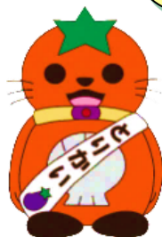
とりかいキャラクター とまねこ