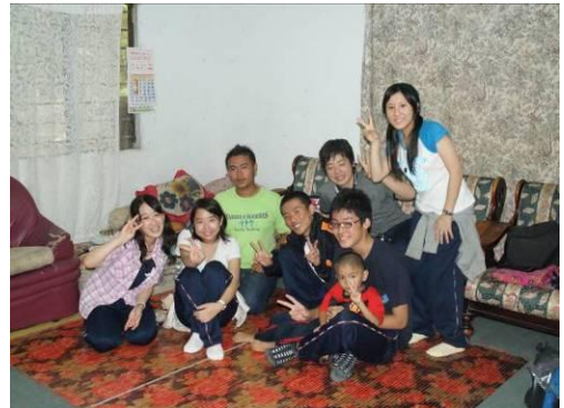
ホームビジット先の家庭で

今回の修学旅行で最も印象的だったのは、64期生が積極的に旅行を楽しもうとしている姿でした。食事やトイレなど、文化の違いに大いに戸惑いながらも、そのことさえも「体験」ととらえ、「負」の要素を「正」に転換していききました。その気持ちがあったからこそ、修学旅行を大成功に導くことができたのだと思います。