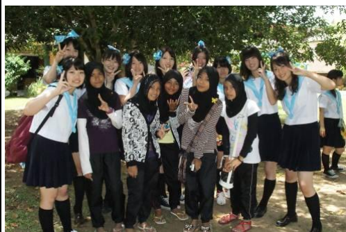
マレーシアの高校生と交流

最終日に行った市内グループ研修は、3番目に満足度が高かった活動です。案内役の学生ボランティアは、日本語学校の学生のはずなのに英語しか話せず、最初は困惑したグループもあったようです。それでも何