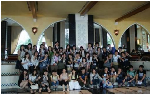
宿舎となった「ホテルイスタナ」

“Sedia Payung Sebelum Hujan.” マレー語で、「雨が降る前に傘を用意する」という意味で、日本では「転ばぬ先の杖」となるのでしょうか。こんなことわざにも雨が使われるように、マレーシアは雨の多い国です。加えて、クアラルンプールは10月から雨期に入ります。旅行中の天候が気がかりでしたが、案の定、直前の週間天気予報では、連日雨の予報が並んでいました。ある程度の雨は覚悟していましたが、毎日降られるのはうんざりするなと思いつつ、日本を立ちました。